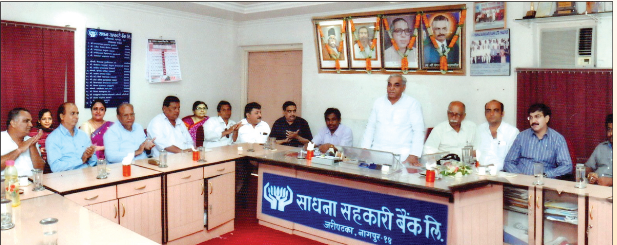
वर्ष २०१७-२२ के कार्यरत साधना सहकारी बैंक के समस्त संचालक मंडल