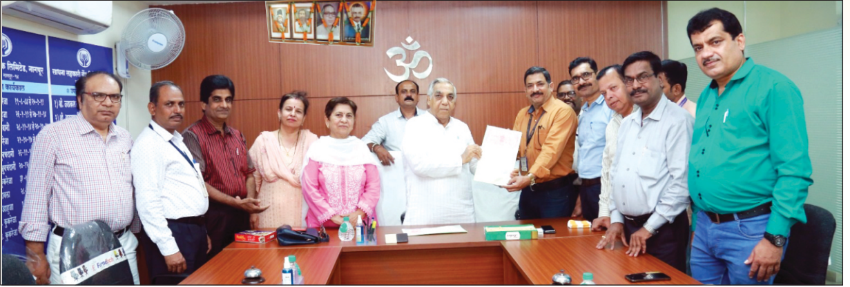
साधना सहकारी बैंक तथा महा. स्टेट को.ऑप. बैंक यूनियन के पदाधिकारियों से बैंक के कर्मचारियों की वार्षिक वेतन वाढ का करारनामा करते हुए बैंक के अध्यक्ष, उपाध्यक्ष, मुख्य कार्यकारी अधिकारी व यूनियन के सचिव व समस्त यूनियन के पदाधिकारीगण