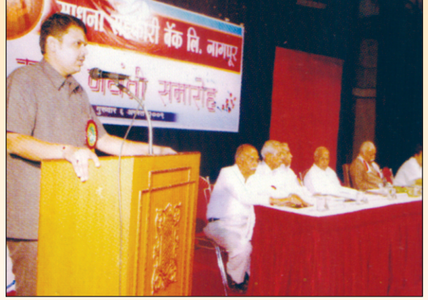
महाराष्ट्र के उपमुख्यमंत्री मा.ना. श्री देवेन्द्रजी फडणवीस बैंक के कार्यक्रम में संबोधित करते हुए।